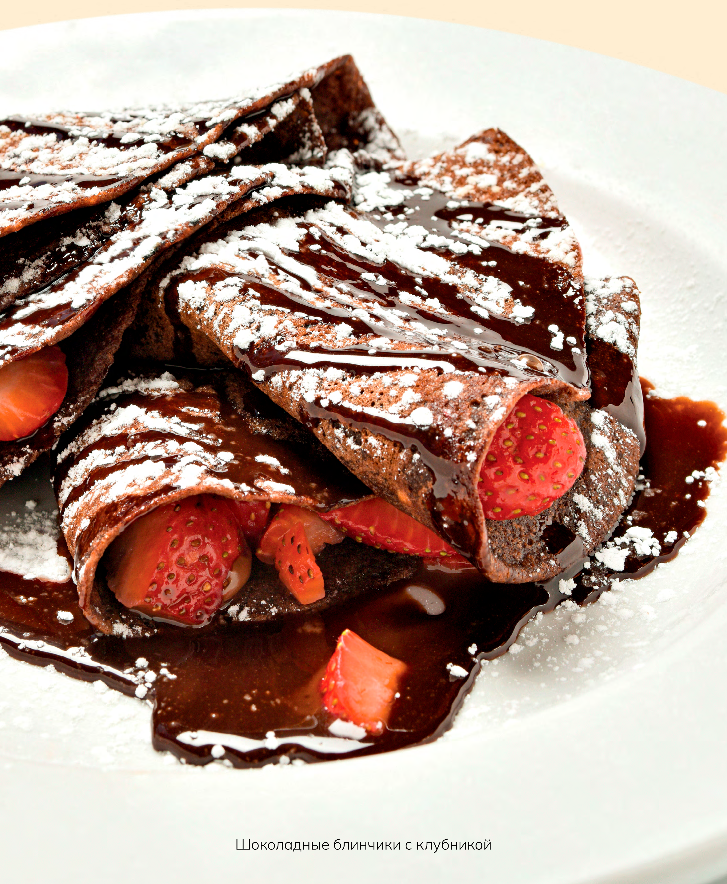
Шоколадные блинчики с клубникой