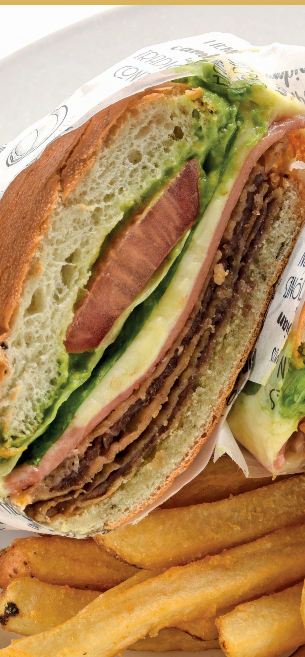
Супер-специальный бутерброд с миланским мясом