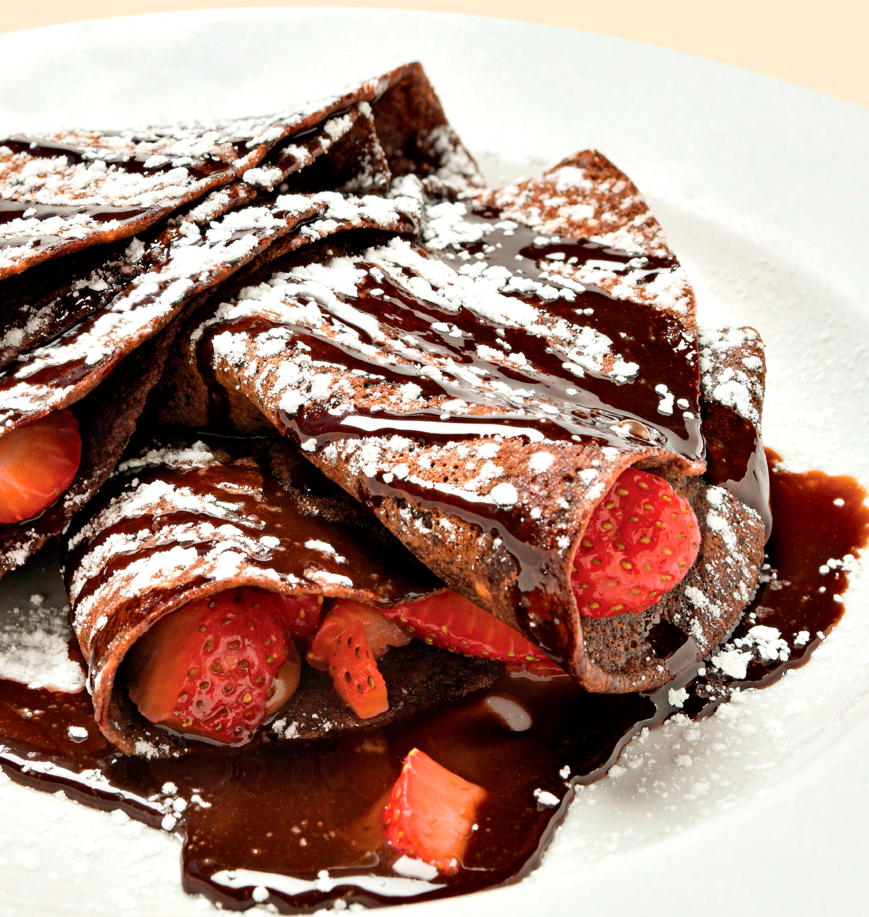
Chocolate and strawberry crepes