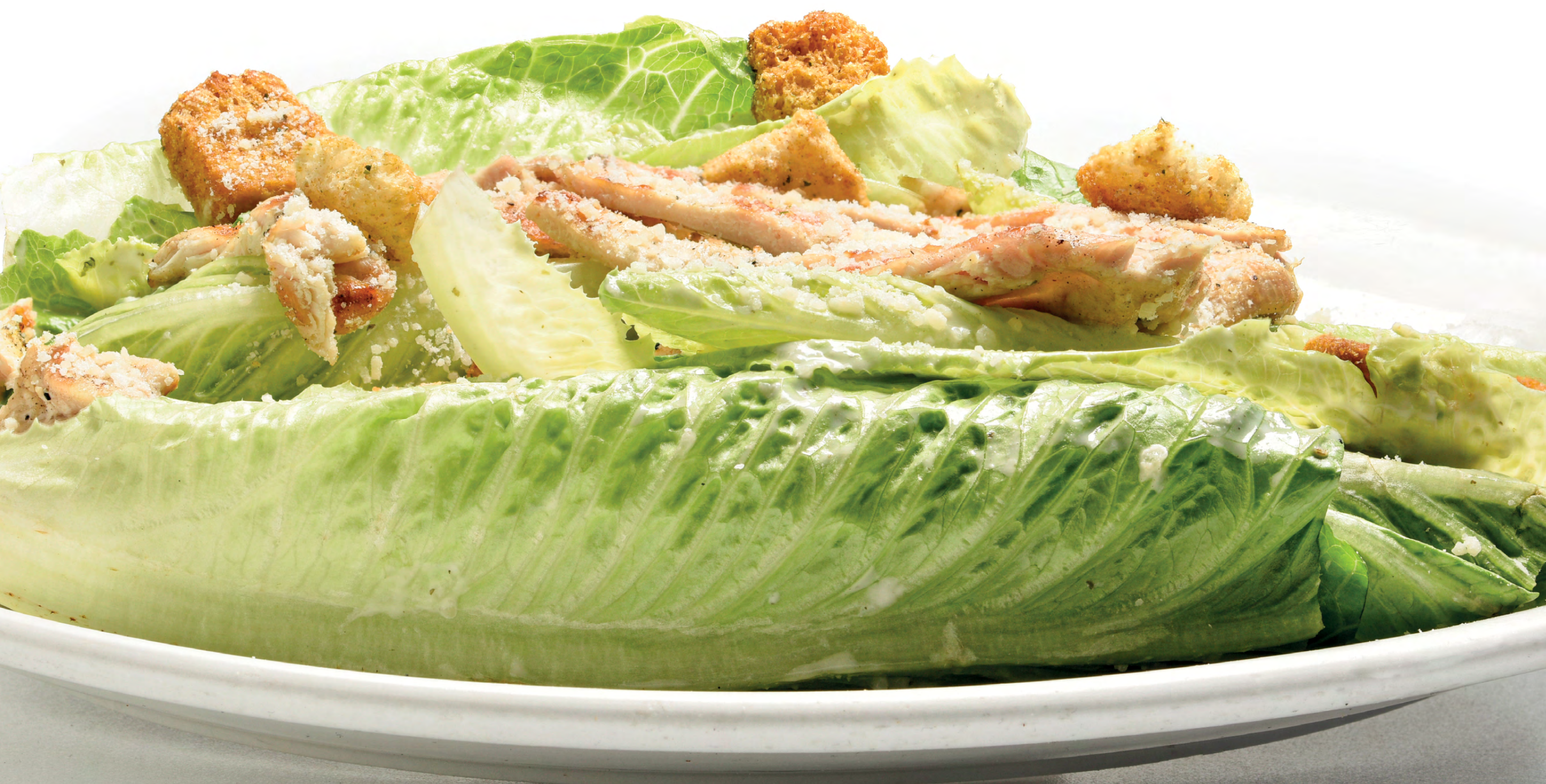
Caesar's salad with chicken breast