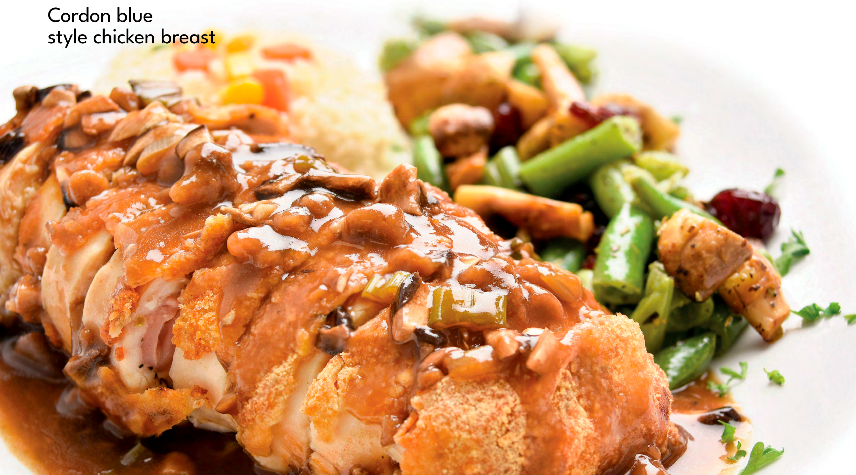
Cordon blue style chicken breast