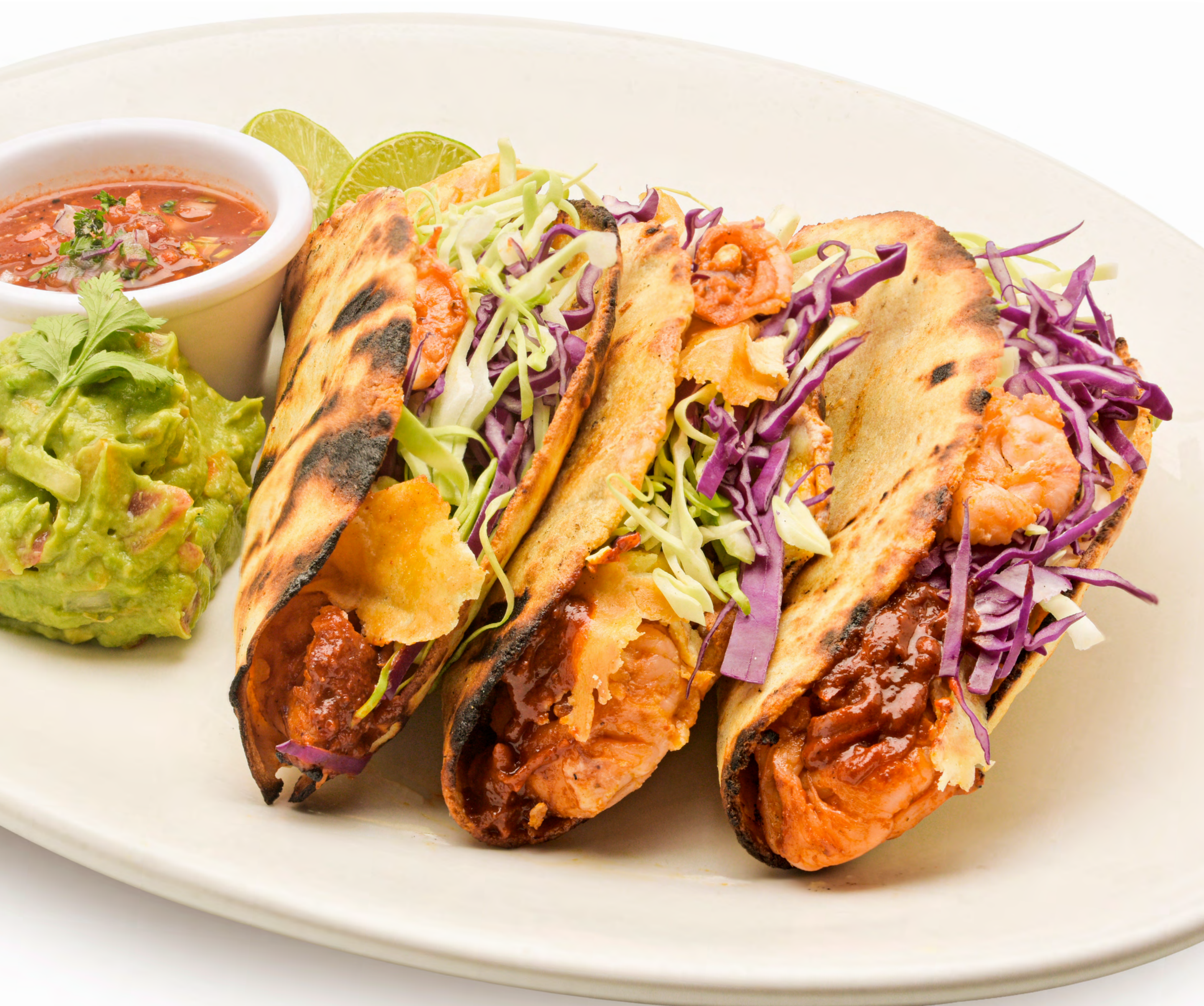
Тако с креветками

креветки, маринованные в фирменном адобо, идеально обжаренные на гриле, с корочкой из ассорти сыров и капустой