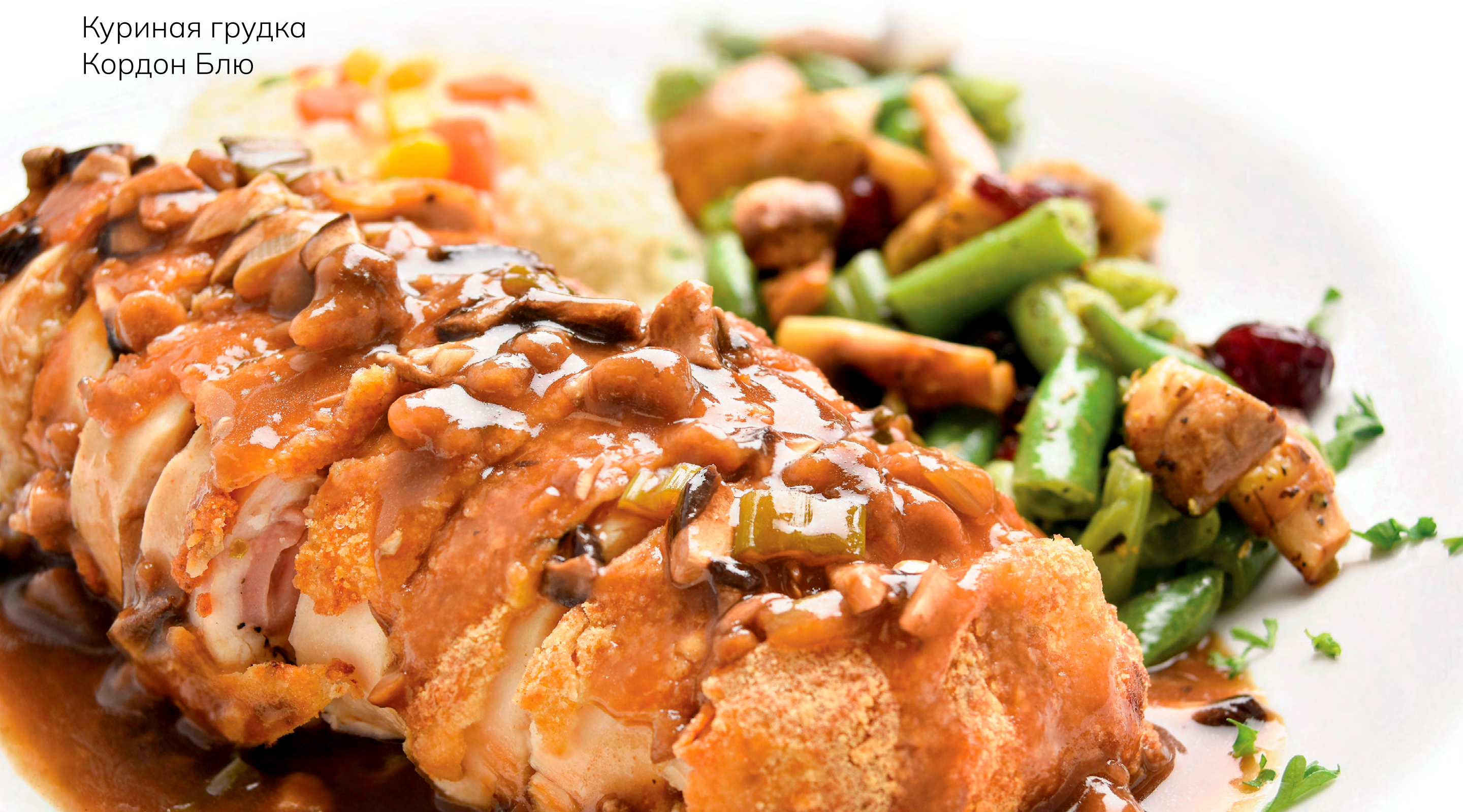
Куриная грудка Кордон Блю