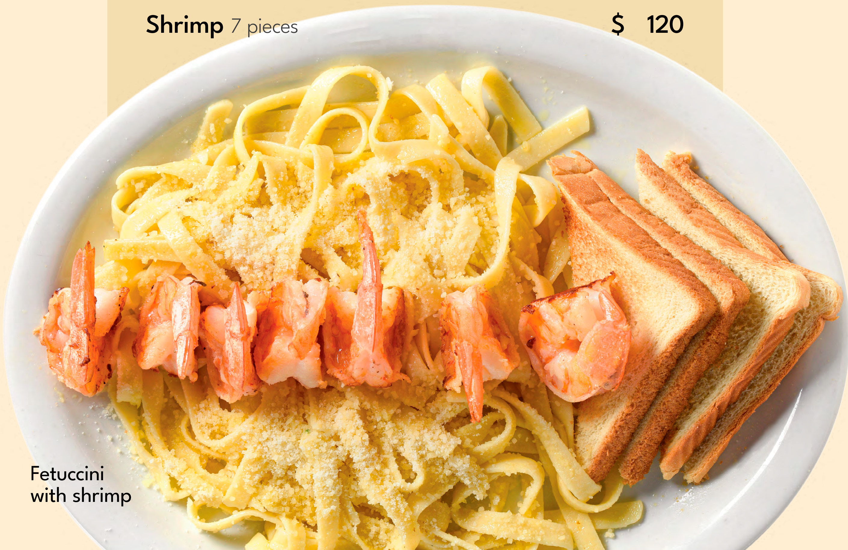
Fetuccini with shrimp