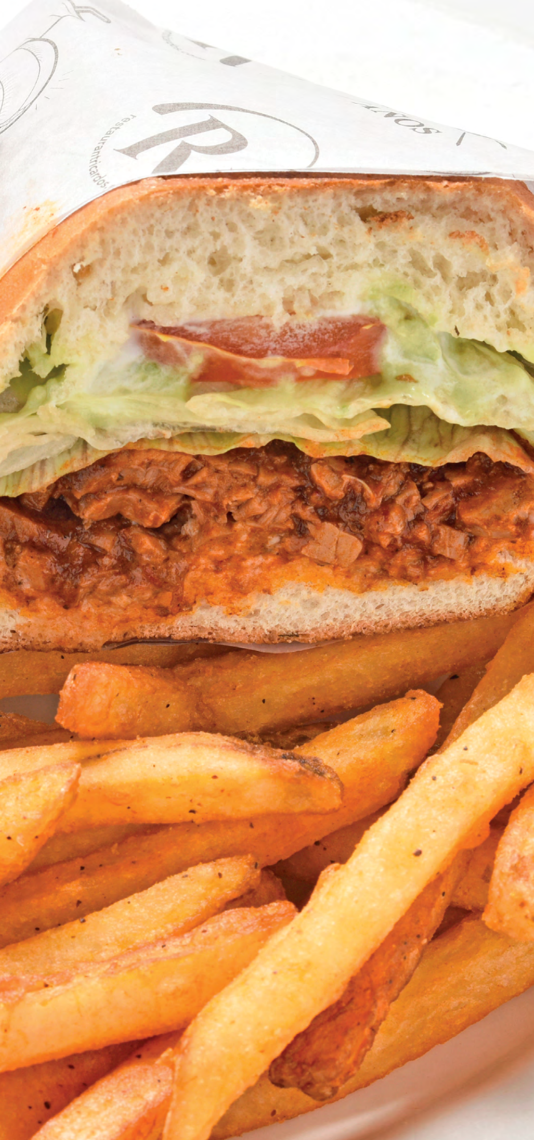
Сэндвич с говяжьим филе