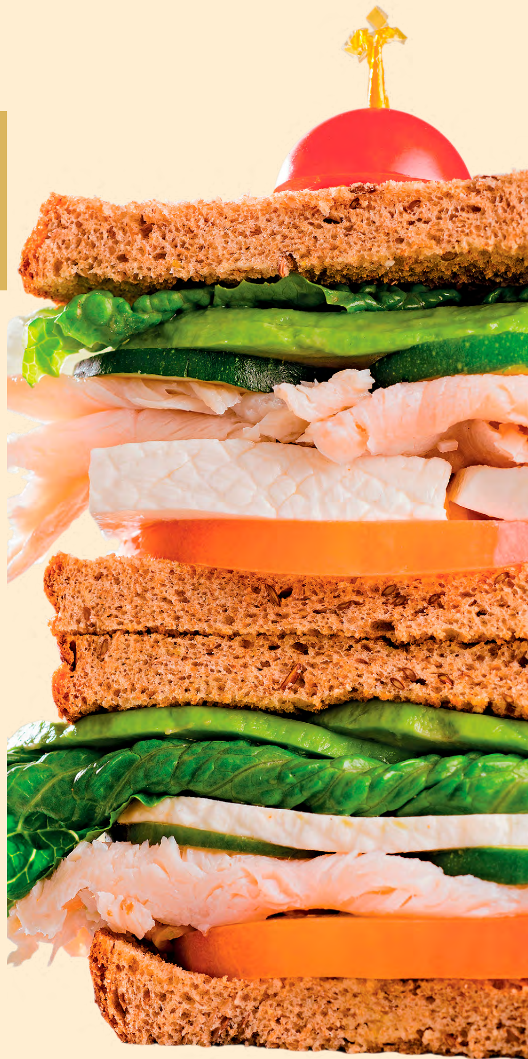
Бутерброд из семи зерен