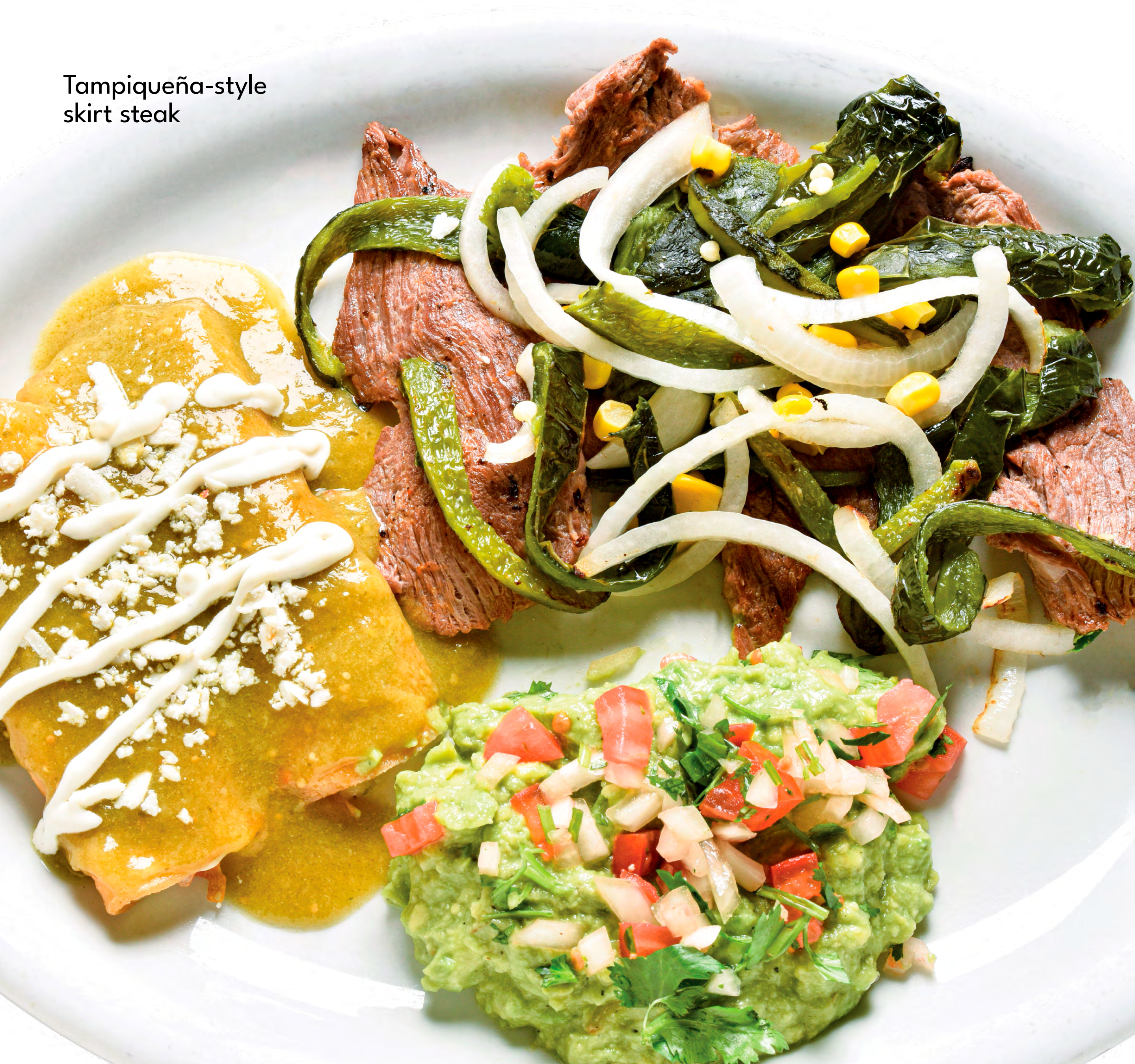
Tampiqueña-style skirt steak