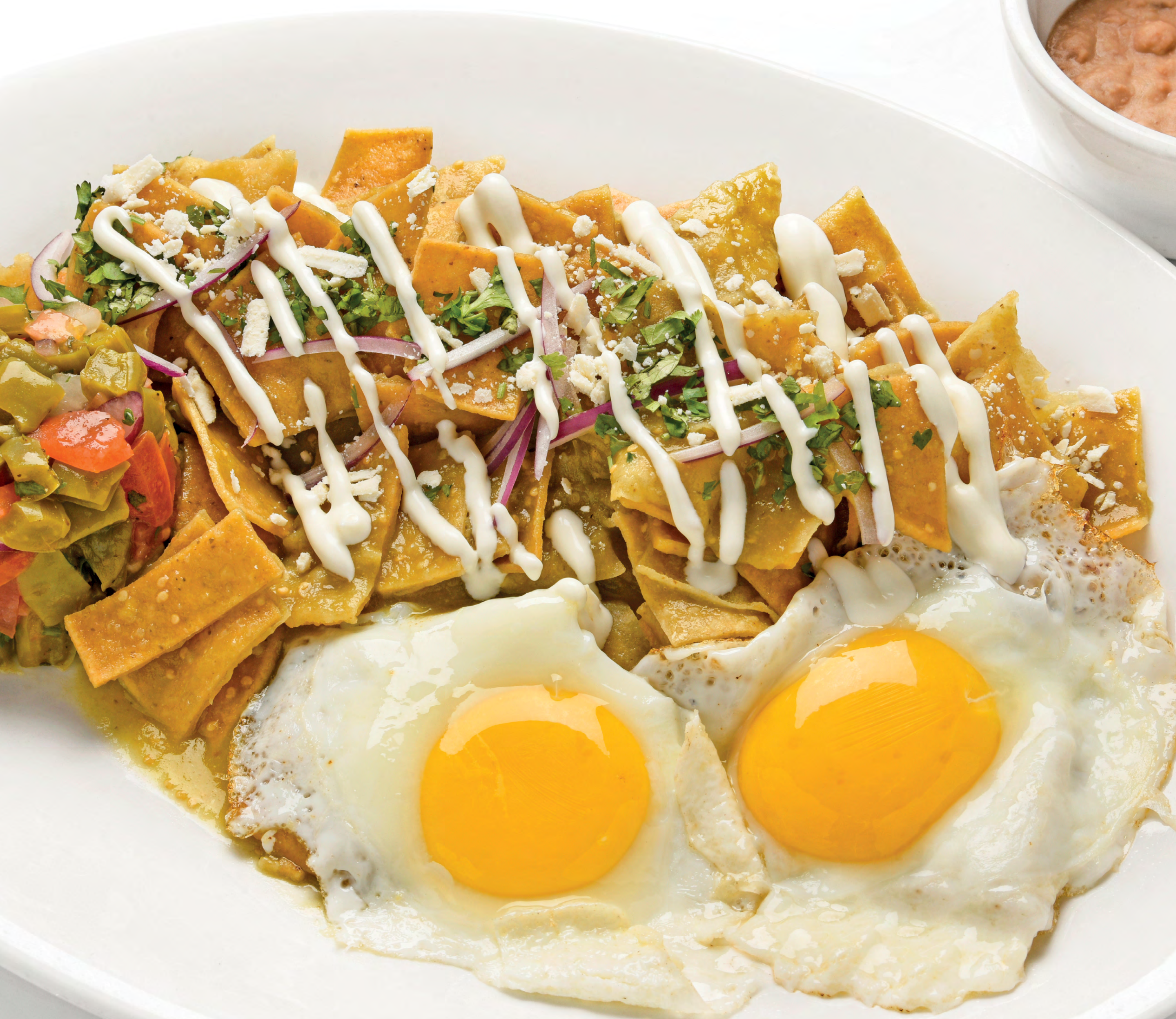
Чилакилес в зелёном соусе с яйцом