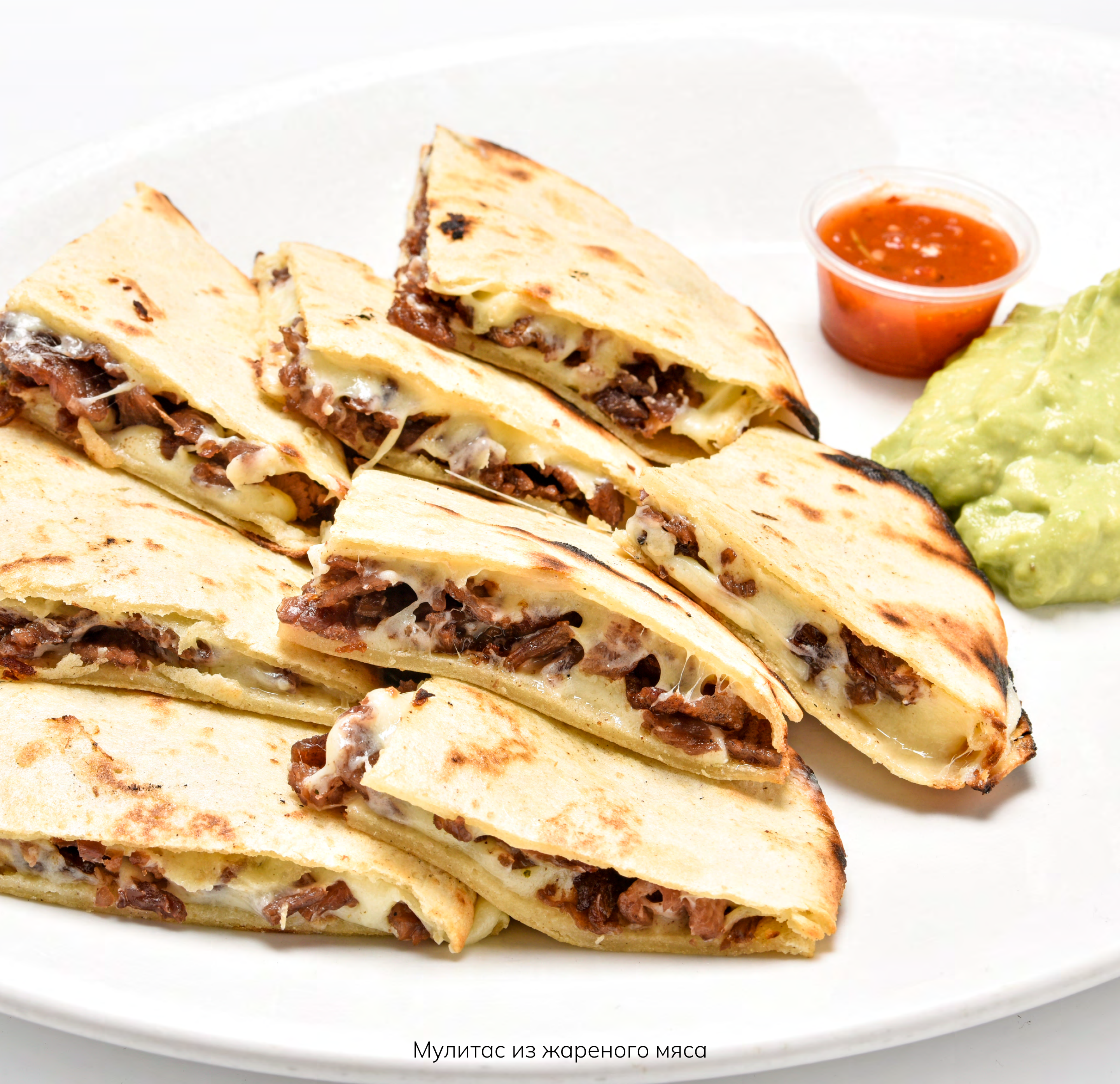
Мулитас из жареного мяса