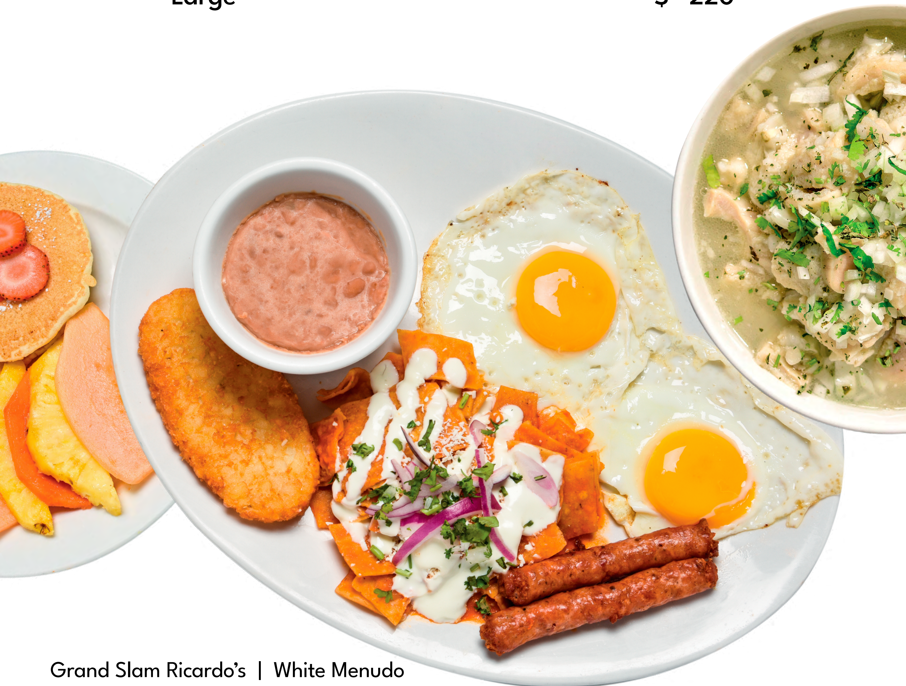
Grand Slam Ricardo's | White Menudo