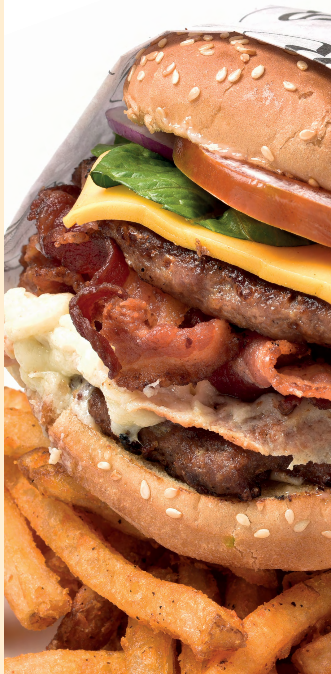
Двойной бургер по-домашнему